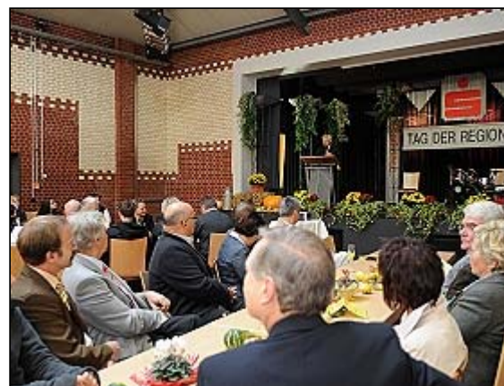
Gut besuchter Tag der Regionen am Wochenende in Bad Salzschlirf

Als Region, die bis 2013 mit insgesamt 1,6 Millionen Euro gefördert werde, wolle man insbesondere in die Privatförderung, sprich die Förderung von Existenzgründern einsteigen. Und die künftigen Unternehmer werden den "Tag der Regionen" sicher auch im