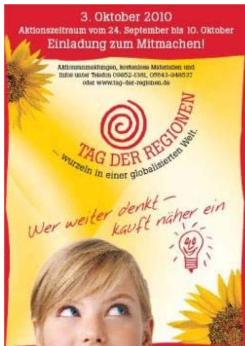
Tag der Regionen. Plakat der Initiative