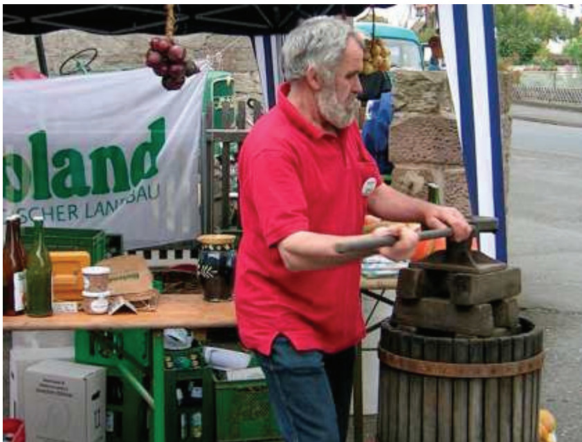
Frisch gepressten Apfelsaft kann am Sonntag auch einmal kosten.