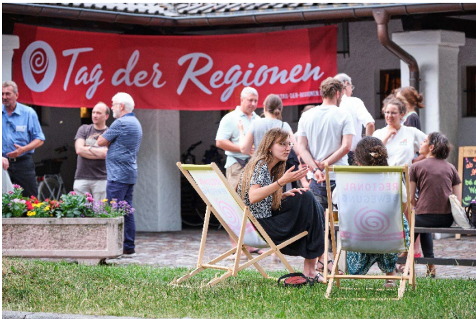
Tag der Regionen Netzwerk auf dem 11. Bundestreffen der Regionalbewegung in Farchant: © Anton Brey, Bundesverband der Regionalbewegung e.V.

Pressebilder zur freien Verwendung unter folgendem Nachweis: