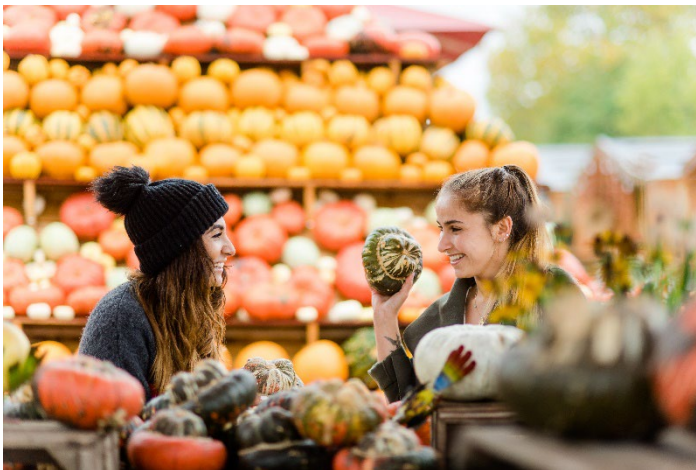
Tag der Regionen Veranstaltung auf dem Getrudenhof in Hürth: © Simon Malik, Bundesverband der Regionalbewegung e.V.